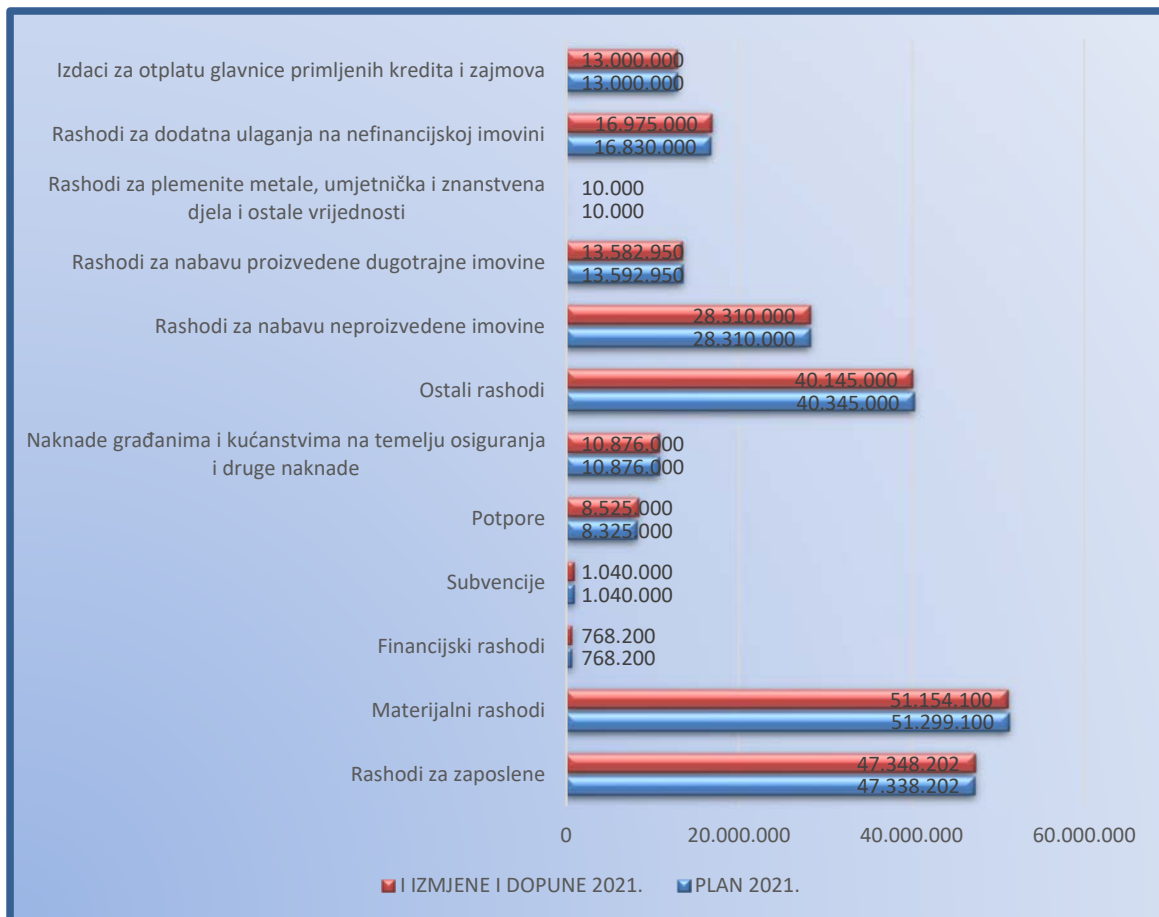
Usporedba rashoda po Planu za 2021.godinu i po I izmjenama i dopunama Proračuna