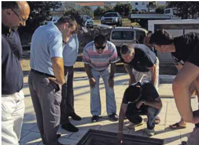
Crpna stanica puna fekalija

Nesavjesni pojedinci ilegalno su se priključili na novi kanalizacijski sustav te otpadnim vodama pune crpnu stanicu u K.Sučurcu, na adresi Cesta dr.F.Tuđmana 55, koja bi, kao i sve ostale, tek krajem godine trebala krenuti u svoj probni rad. Problem je uočen sredinom lipnja, nakon čega su odmah pozvane sve nadležne