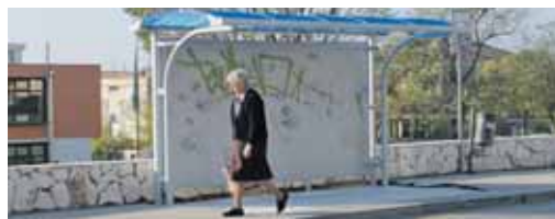
Nadstrešnice već išarane

Tako je sada od ukupno 43 autobusne postaje na toj prometnici ostalo 15 nenatkrivenih jer je osim ovih 11 novih ranije