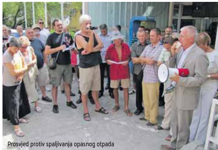
Prosvjed protiv spaljivanja opasnog otpada

U Cemexovim se tvornicama planira djelomično zamijeniti petrokoks, kao energent u rotacijskim pećima, drvnim otpadom (otpadni drveni željeznički pragovi i otpadni drveni namještaj), koji može biti i opasan. Zbog toga je izrađena Studija utjecaja na okoliš, kojom se dokazuje kako na temperaturi od 800 do 2000 stupnjeva Celzijevih postoje uvjeti za potpunu razgradnju organskih i drugih spojeva. Ekolozi i pojedini stručnjaci se ne slažu s tim, te upozoravaju kako ipak postoji opasnost za zdravlje građana, ne samo u Kaštelima nego i širem okolišu.