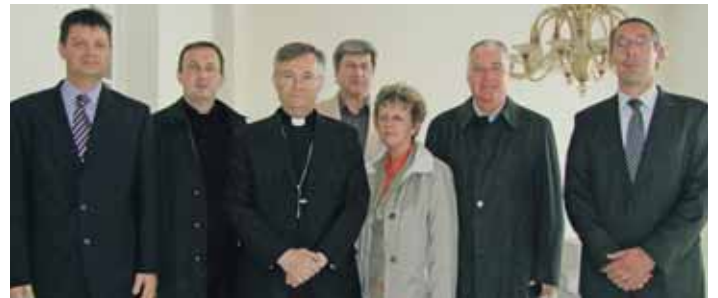
Izaslanstvo grada kod nadbiskupa