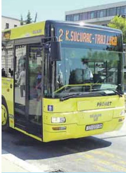
Zastarjeli Prometov vozni park

Većinski vlasnik Prometa je Grad Split, dok je udio Grada Kaštela svega devet posto. Kaštelainfo