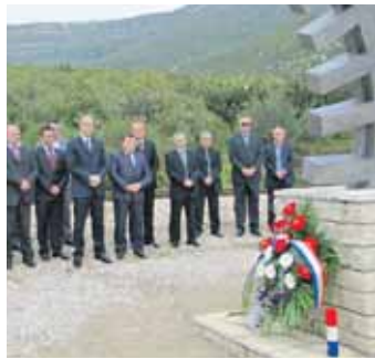
Spomenik poginulim putnicima

Na željezničkoj pruzi u Rudinama, gdje se prije nešto više od dvije godine dogodila teška željeznička nesreća, predstavnici Ministarstva mora, prometa i infrastrukture, Hrvatskih željeznica, Državne uprave za zaštitu i spašavanje, Županije Splitsko-dalmatinske i Grada Kaštela i ove su godine u povodu Svih svetih odali počast šestorici poginulih putnika iz stradalog vlaka.